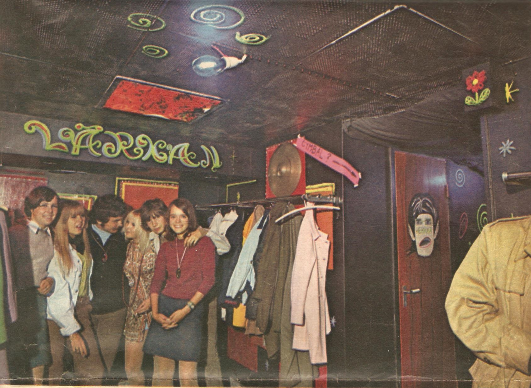
Lärkan – popkulturhuset i Sundbyberg – är exempel på hur mysigt det kan bli om bara kommunalpamparna lyssnar på ungdomen.